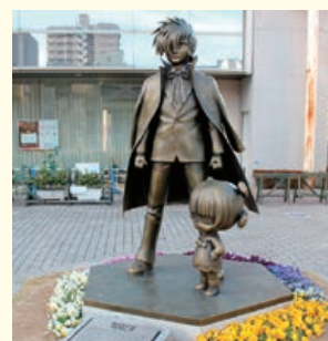
ブラック・ジャック&ピノコ像

手塚の出身地は兵庫県の宝塚市ですが、東久留米市もまた、最盛期の約10年をこの地で生活していますので、東久留米市は手塚治虫所縁(ゆかり)の地とも言えるでしょう。